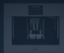
Ekspres do kawy